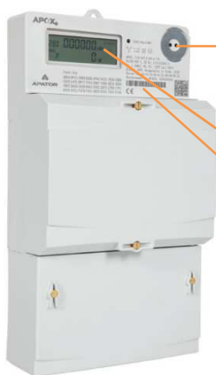
Beispielhafte Abbildung, Abweichungen und Änderungen vorbehalten

Optischer Lichtsensor für die Eingabe der PIN und zum Aufruf der Momentanleistung und historischer Verbrauchswerte