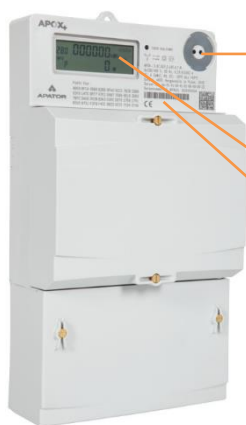
Beispielhafte Abbildung, Abweichungen und Änderungen vorbehalten

Optischer Lichtsensor für die Eingabe der PIN und zum Aufruf der Momentanleistung und historischer Verbrauchswerte