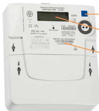
Beispielhafte Abbildung, Abweichungen und Änderungen vorbehalten

➔ Bedientaste für die Eingabe der PIN und zum Aufruf der Momentanleistung und historischer Verbrauchswerte