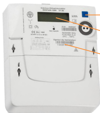
Beispielhafte Abbildung, Abweichungen und Änderungen vorbehalten

Bedientaste für die Eingabe der PIN und zum Aufruf der Momentanleistung und historischer Verbrauchswerte