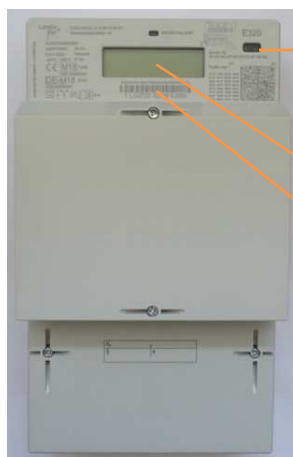
Beispielhafte Abbildung, Abweichungen und Änderungen vorbehalten

→ Optischer Lichtsensor für die Eingabe der PIN und zum Aufruf der Momentanleistung und historischer Verbrauchswerte