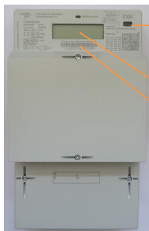
Beispielhafte Abbildung, Abweichungen und Änderungen vorbehalten

→ Optischer Lichtsensor für die Eingabe der PIN und zum Aufruf der Momentanleistung und historischer Verbrauchswerte