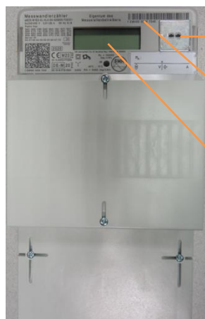
Beispielhafte Abbildung, Abweichungen und Änderungen vorbehalten

→ Optischer Lichtsensor für die Eingabe der PIN und zum Aufruf der Momentanleistung und historischer Verbrauchswerte