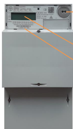
Beispielhafte Abbildung, Abweichungen und Änderungen vorbehalten

Optischer Lichtsensor für die Eingabe der PIN und zum Aufruf der Momentanleistung und historischer Verbrauchswerte