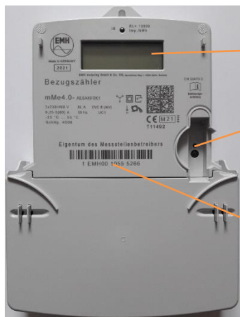
Beispielhafte Abbildung, Abweichungen und Änderungen vorbehalten