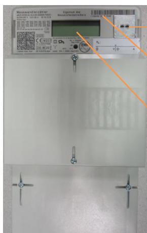
Beispielhafte Abbildung, Abweichungen und Änderungen vorbehalten

Optischer Lichtsensor für die Eingabe der PIN und zum Aufruf der Momentanleistung und historischer Verbrauchswerte